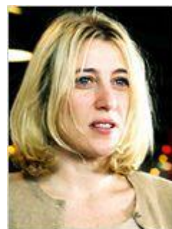
Cendrine Valeria Bruni Tedeschi